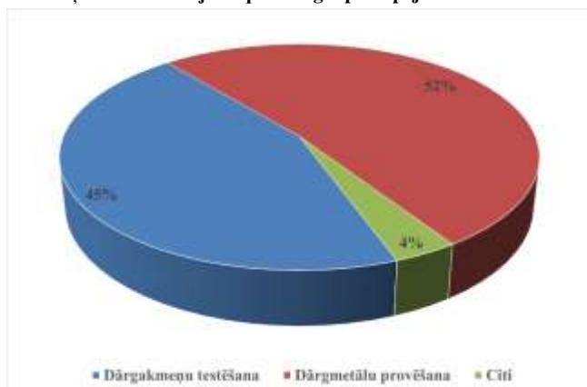
Ieņēmumu sadalījums pēc sniegto pakalpojumu veida

Provēto un zīmogoto izstrādājuma skaits ir ievērojami mazāk par plānoto (-41%), tomēr provēto dārgakmeņu skaits ir lielāks par plānoto (+5%). Provēto izstrādājumu skaita kritums ir saistīts ar Covid-19 pandēmijas rezultātā izsludināto ārkārtas stāvokli. Kopumā klientu plūsma 2021.gadā ir ievērojami mazāka par 2020.gadā sasniegto rezultātu (-19% (klientu apkalpošanas reizes)). Pandēmijas rezultātā tika novērots ļoti izteikts klientu aktivitātes kritums (provētie zelta izstrādājumi: +1%, sudraba: -37%), zelta izstrādājumu vidējais svars ir palielinājies līdz 2,18 g.